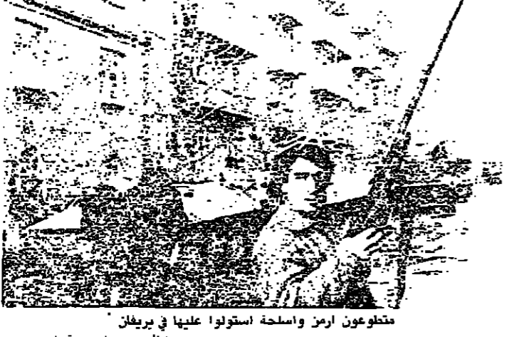
متطوعون ارمن واسلحة استولوا عليها في بريان

كافة تأس السوفييتية ان انباء التي تصل الى المدينة انخفضت بنسبة الثلثين. وتسيطر المعارك في المناطق المتاخمة لغاغوريين كاراباخ وبخاصة شمالي المنطقة التي تتمتع بحكم ذاتي. وابتدت مساعي ارمينية قومية تم الاتصال بها في بريان اسبوعا اسبوعا من ان تقوم الجيش بجلاء سكان غوغاتش شمال غاغوري كاراباخ بينما اعطى مثل قومي في باكو اسم انه تم اجلاء السكان الازربيجانيين في 11 قرية بمنطقة كويالي تقع بين كاراباخ وارمينيا بسبب اطلاق النار المتواصل من جانب الارمن. وفي ناغورني كاراباخ وقع اعتداء ادى الى تدمير خزائن المياه الذي يغذي سبيلتاكبيرت اكبر مدن المنطقة ونذرت